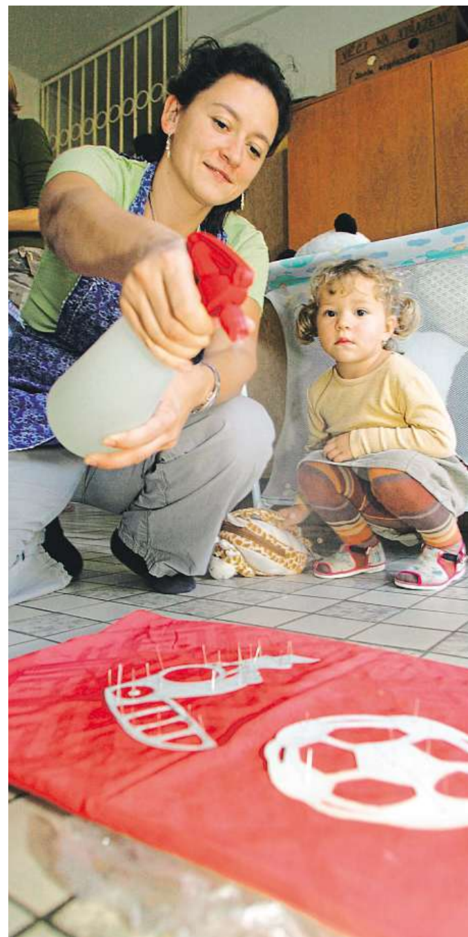
Práce i s dítětem Stále více žen na rodičovské dovolené má zájem rozjet vlastní podnikání.